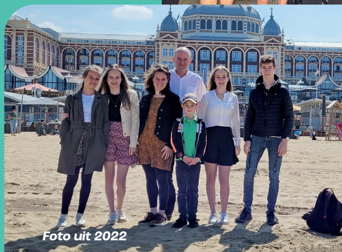
Foto uit 2022